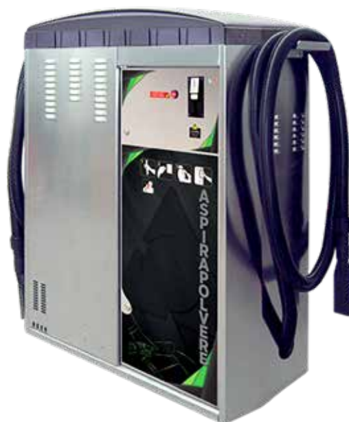
ECO 400-D ECO 230-D

Zařízení se dvěma vysavači Zariadenia s dvoma vysávačmi Készülék két porszívóval