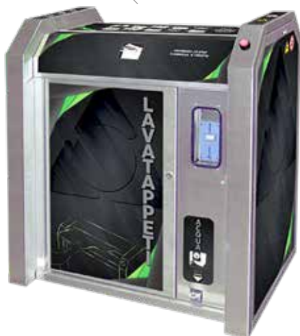
LT 400 LT 230